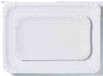
BANDEJA CARTON Nº9 24x31 100 UD.