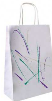
BOLSA PICNIC MOD. VOLARE C/250 UD.