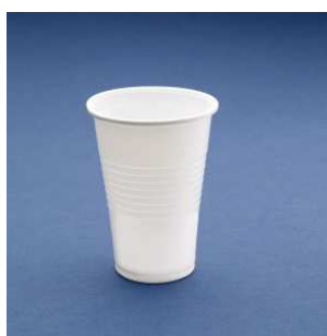
VASO PLASTICO 220CC BLANCO C/32x100 UD.

No se astilla, es flexible y es prácticamente irrompible. Esta producido con Polipropileno, material de alta resistencia que soporta temperaturas entre -20 y + 120 °C.