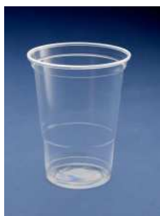
VASO 500CC C/1600 UD.

No se astilla, es flexible y es prácticamente irrompible. Esta producido con Polipropileno, material de alta resistencia que soporta temperaturas entre -20 y + 120 °C.