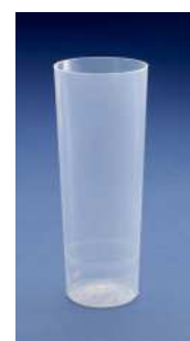
VASO TUBO 300 CC P.P. C/50X100.