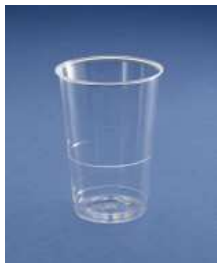
VASO 250ML PRECINTO INDIVIDUAL C/1000 UD.