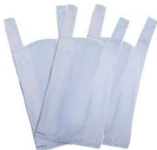
BOLSA DE ASA 50x60 P/200 UD.