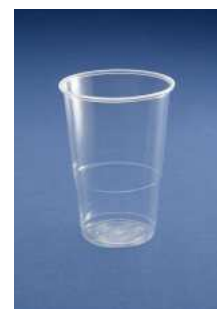
VASO TRANSPARENTE 330 CC C/2800 UD.

No se astilla, es flexible y es prácticamente irrompible. Esta producido con Polipropileno, material de alta resistencia que soporta temperaturas entre -20 y + 120 °C.