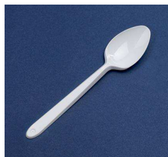
CUCHARILLA CAFE PLASTICO C/20x100 UD.