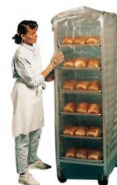
FUNDA CARRO ALIMENTACIÓN C/6x50UD.

Las fundas para carros, protegen los alimentos al hacer barrera contra el vapor, polvo, olores, etc. Fabricadas en material P.E.H.D. transparente. Tamaño: 133x204 Color: Transparente